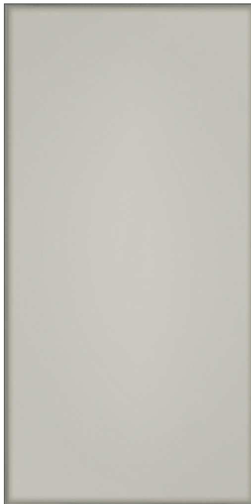
FUME (Gris) Poli

20 x 60 cm (7.87" x 23.622") RF.VT.BZO.0824.PL