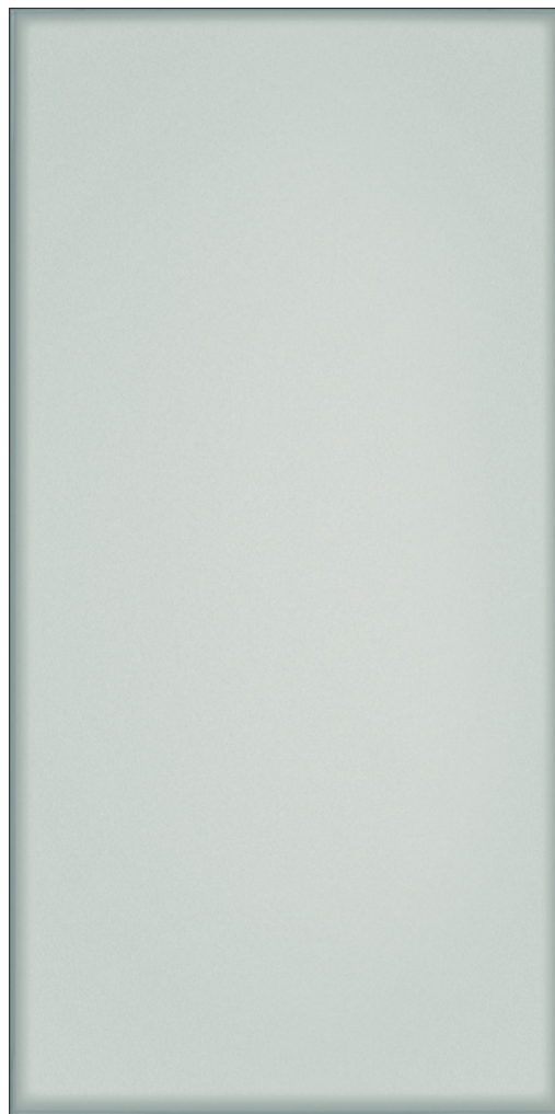
NATURAL (Gris/Bleu) Poli

20 x 60 cm (7.87" x 23.622") RF.VT.BIA.0824.PL