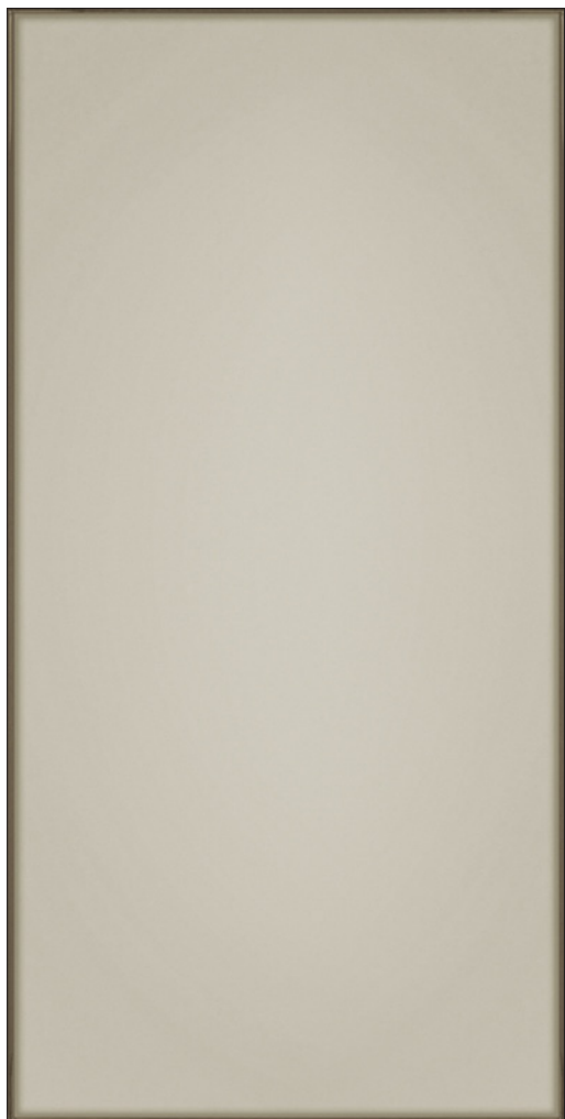
BRONZO (Taupe) Poli

60 x 60 cm (23.622" x 23.622") RF.VT.BZO.2424.PL